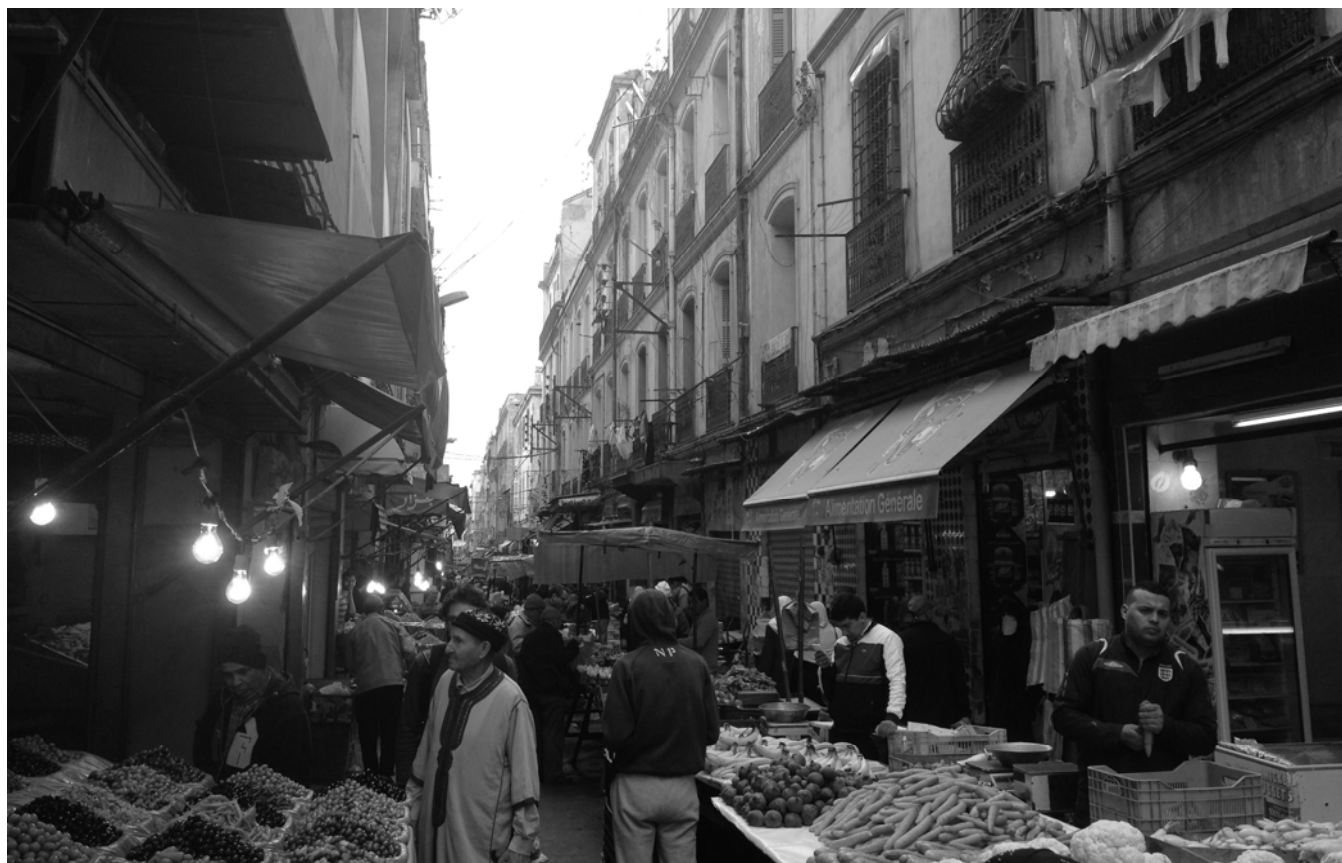
Marché de la Bastille, Oran, Anne Bouhali, 2016