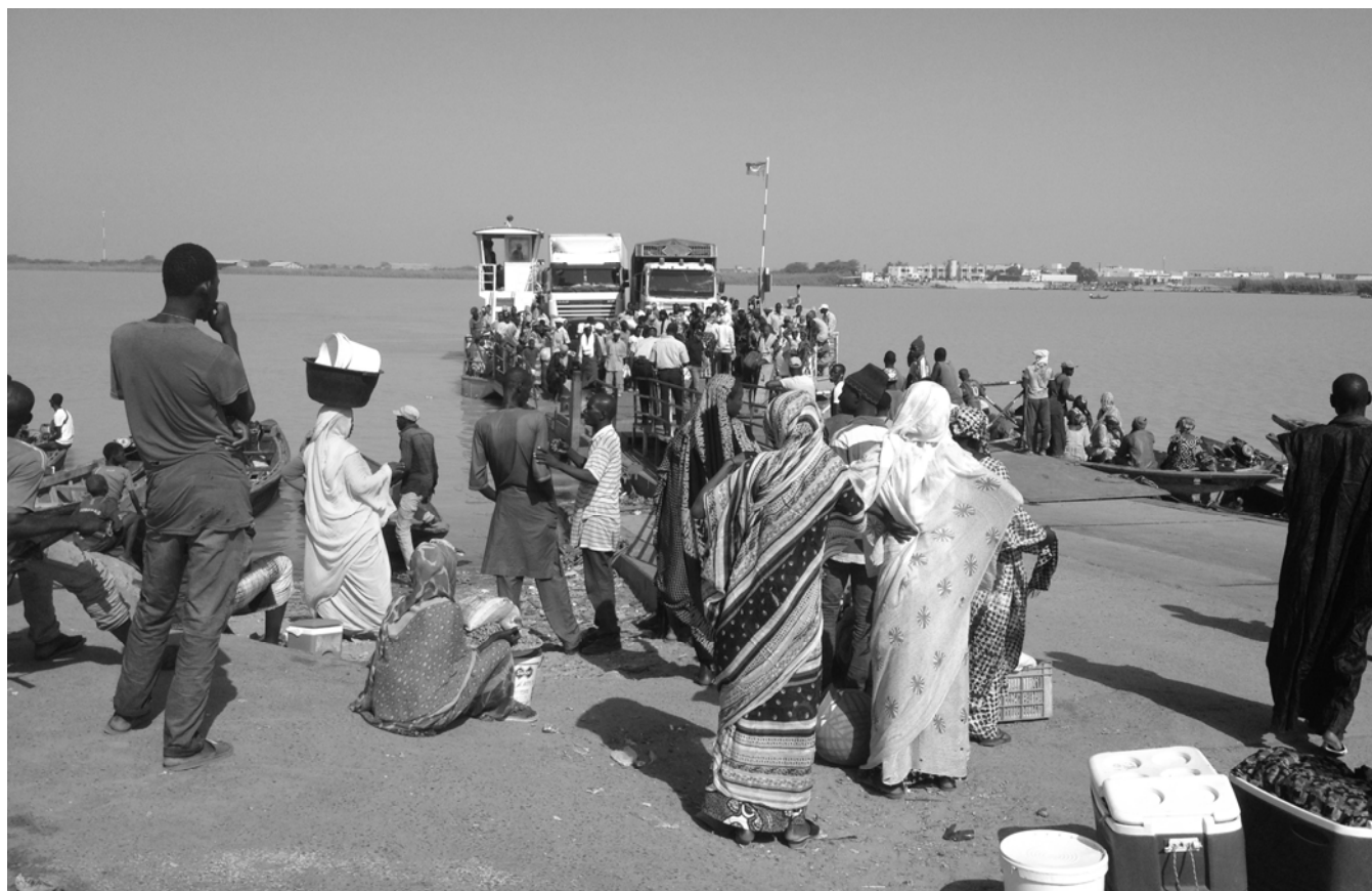
Le bac à Rosso, Sénégal, Anne Bouhali, 2017