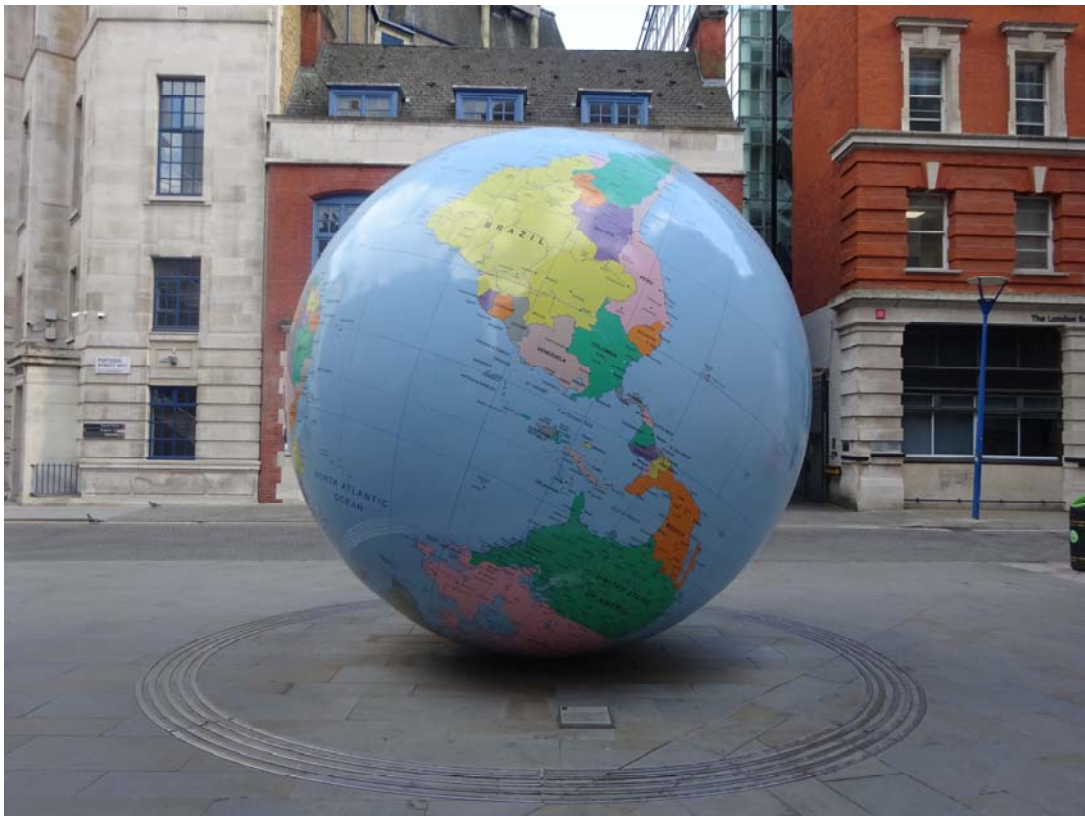
Oeuvre dans l'espace public à Londres, S. Guillard, 2022