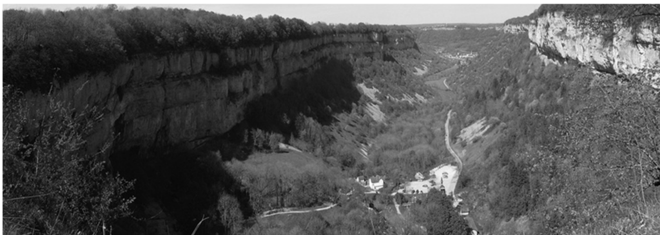
Reculée des planches vue depuis le fer à cheval, Les Planches-près-Arbois (Jura), Chalumeau Laurent, 2019