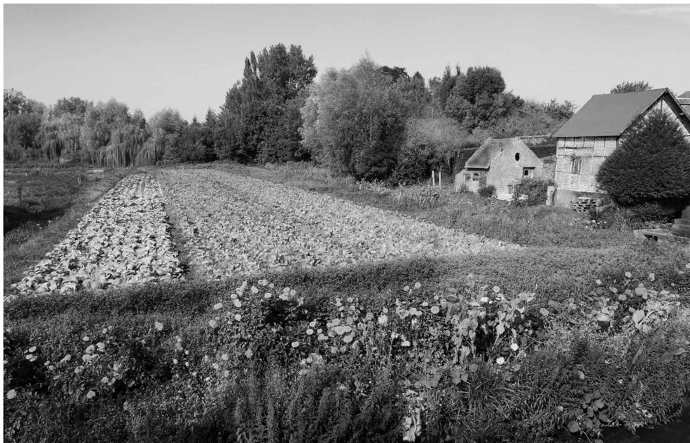
Les hortillonnages, Amiens, Jean-Marc Hoeblich, 2015