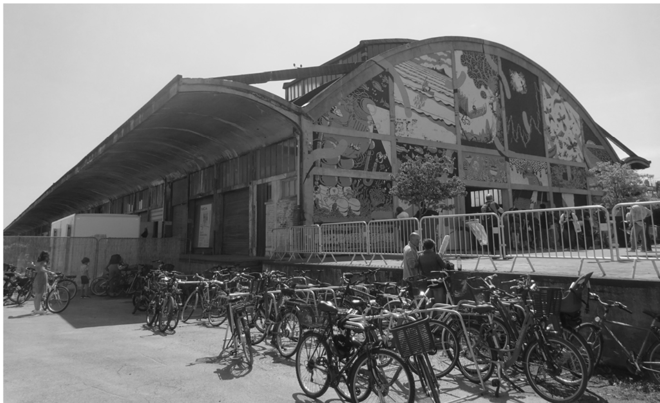
La Halle Freyssinet lors du festival de la BD, Amiens, S. Guillard, 2022